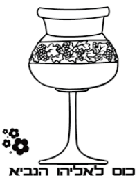
כוס כאליה הנביא