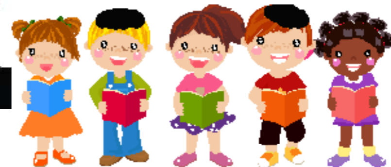
גרפיקה: אורה אלאלוף. עריכה לשונית: דינה בר ציון